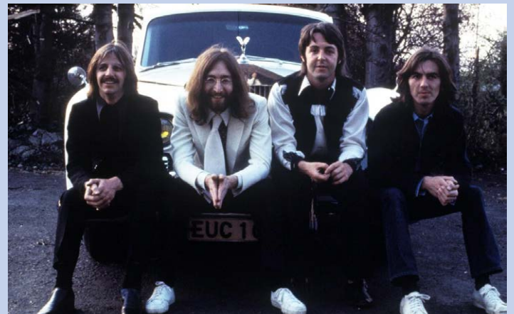
Beatles: doc contextualiza ‘última música’

Um documentário de 12 minutos sobre a “última música” dos Beatles foi lançado nesta quarta-feira, 1º. O curta-metragem, chamado “Now And Then - The Last Beatles Song”, foi dirigido por Oliver Murray e já estreou no canal do Youtube da banda.