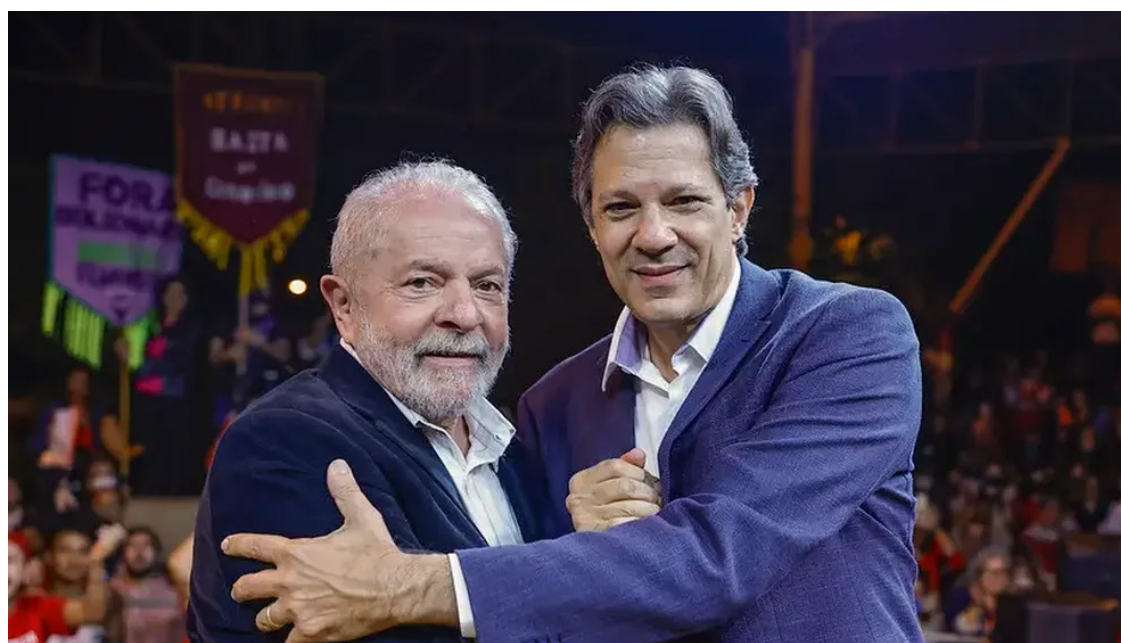
Lula da Silva e Fernando Haddad: contradições na política econômica e incertezas eleitorais

Como resultado, Lula acabou ampliando as incertezas sobre a evolução dos indicadores econômicos do país, sobretudo naquilo que mais o incomoda: a