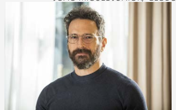
Caco Ciocler é protagonista da série médica 'Unidade Básica'