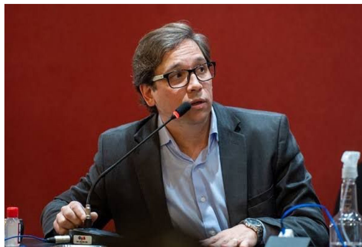
Realle Palazzo: defesa da democracia