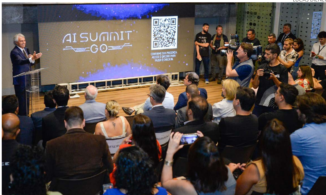
Governador Ronaldo Caiado debate com empresários e pesquisadores importância da Inteligência Artificial