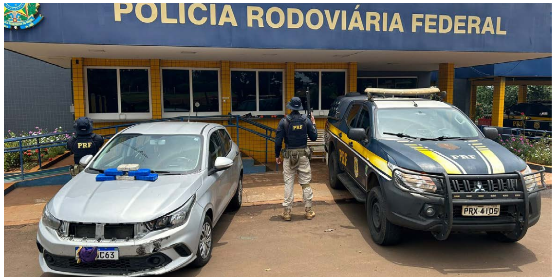
EM RIO VERDE: PRF encontra cerca de 6,25kg de uma substância análoga à pasta base de cocaína

O carro era conduzido por este homem de 43 anos, acompanhado da mulher de apenas 27 anos. Ela está grávida de três meses, inclusive. Ambos foram encaminhados à Delegacia da Polícia Federal em Jataí.