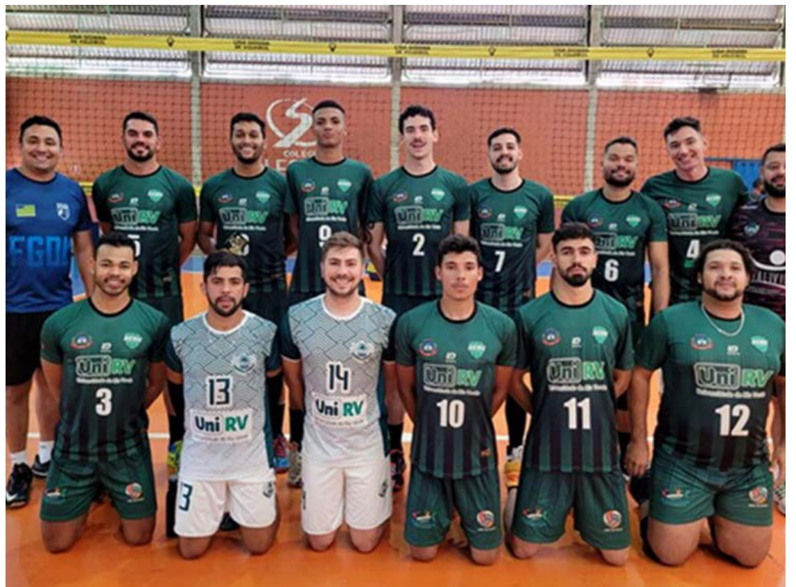
Time da UniRV se prepara para disputar uma das ligas nacionais de voleibol — Foto: Reprodução.

Nas categorias masculino e feminino da Superliga, quatro times goianos estarão na disputa, já que competem dois clubes do Estado entre os homens (Ace/Aparecida e UniRV) e também dois entre as mulheres (Ace/Aparecida e Lona Voleibol).