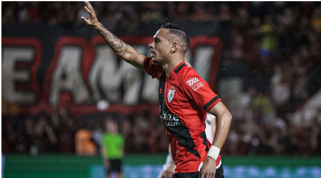
Em jogo bastante disputado no Accioly, o Atlético-GO empata em 2 a 2 com o Novorizontino