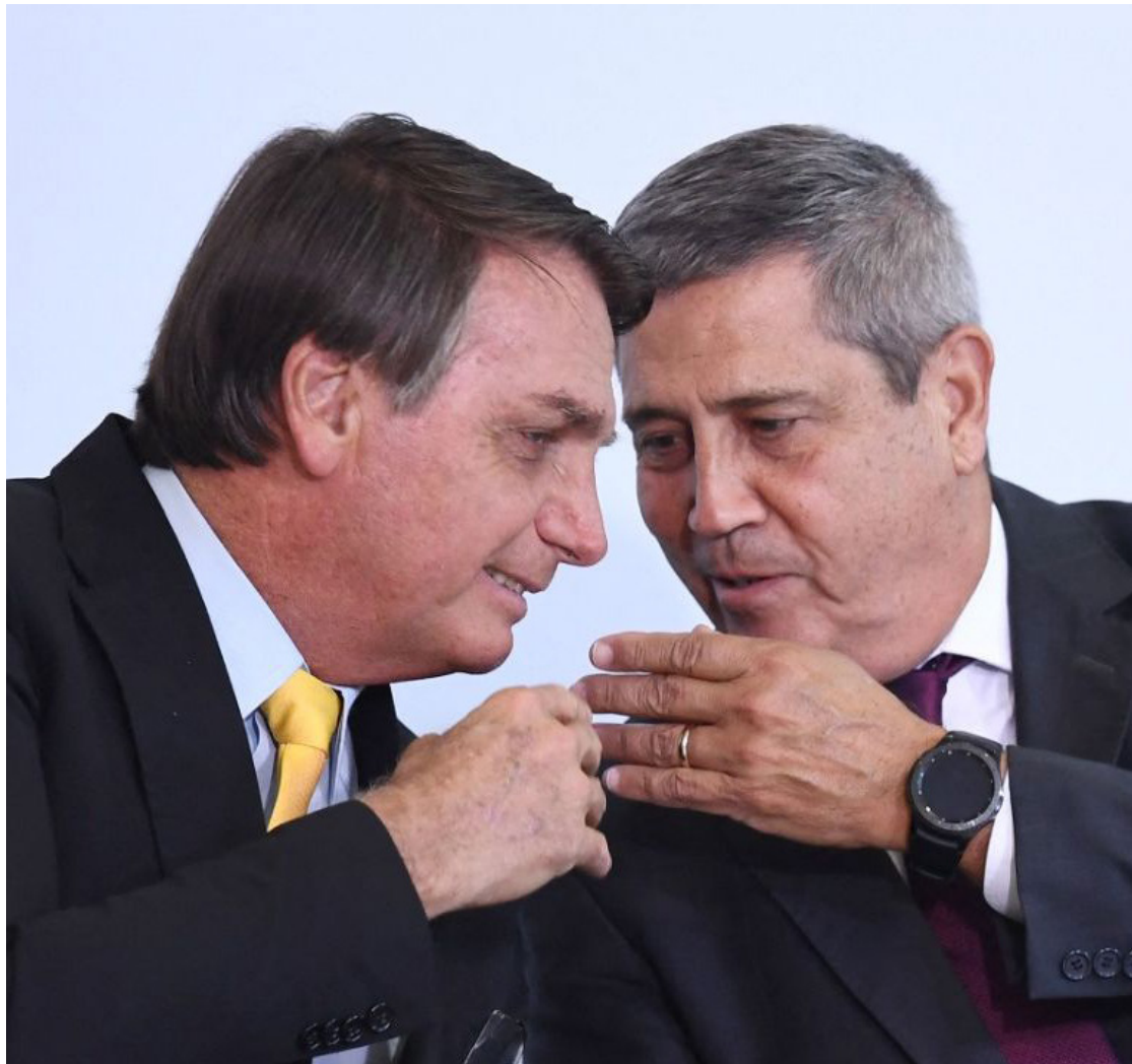
Jair Bolsonaro e Braga Netto: fora das eleições de 2024 e 2026

A decisão do TSE também multa Bolsonaro e Braga Netto