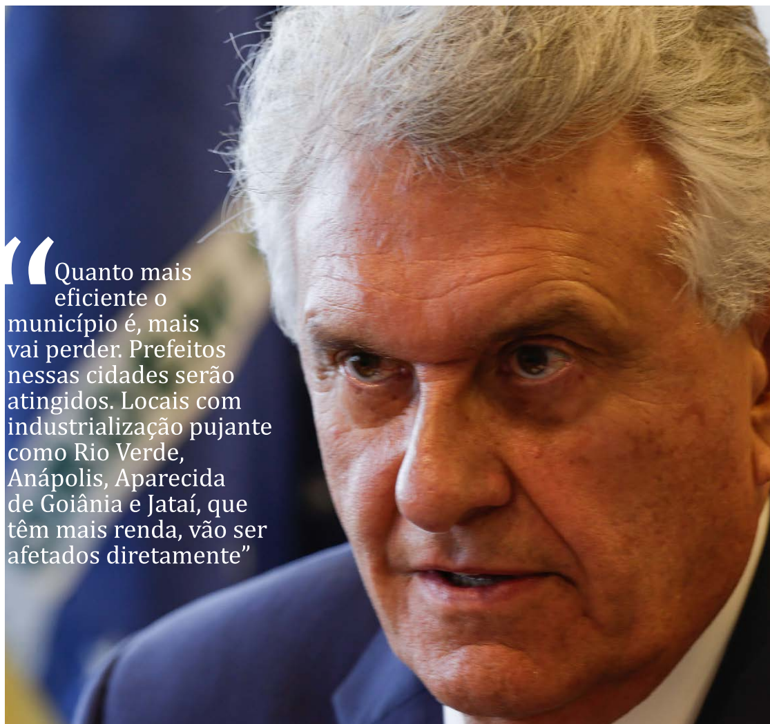
Ronaldo Caiado: mobilização prossegue no Senado contra projeto de reforma tributária

A declaração foi dada durante entrevista ao programa Fábio Sousa com Você, da Fon-