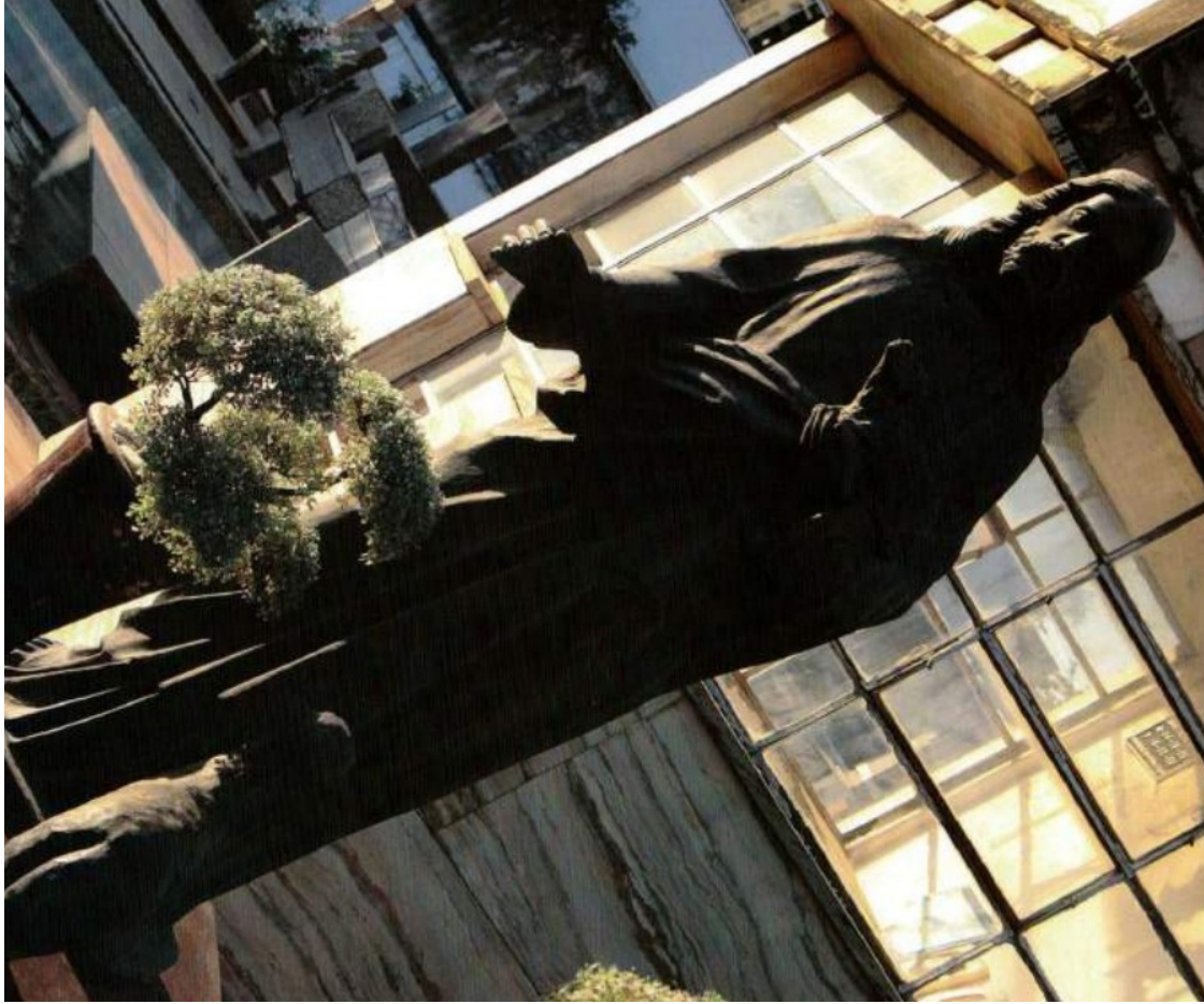
Arte documentada: fotógrafo R.Romano se interessou por clicar obras com sua máquina